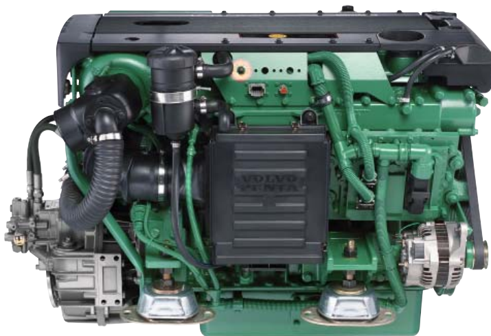
D4-225 avec inverseur HS45AE

Le moteur 4 cylindres D4-225 de Volvo Penta a été développé en bénéficiant des tous derniers concepts de la technologie diesel moderne. Il est doté d'un système d'injection directe à rampe commune avec deux arbres à cames en tête, 4 soupapes par cylindre, turbo compresseur et échangeur de température. Grâce au grand volume d'air balayé et au système EVC (Electronic Vessel Control), il atteint de très hautes performances avec de faibles rejets polluants.